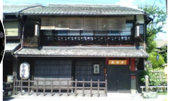
■寺田屋■幕末期、討幕派の定宿となった所。薩摩藩士同士の闘争事件、寺田屋騒動のあった場所として知られる。当時の建物がそのまま使われており、刀傷や、弾痕は今も残る。また、坂本龍馬が後に妻となるお龍の転機で、危うく難を逃れた所としても有名です。

【旅程表】 8:00出発→鈴鹿IC→宇治東IC→10:20平等院11:20→11:30昼食「喜撰茶屋」12:30→12:50寺田屋13:30徒歩13:40月桂冠大倉記念館14:30→15:00井筒八ツ橋本店15:30→京都東IC・鈴鹿IC→18:00到着予定