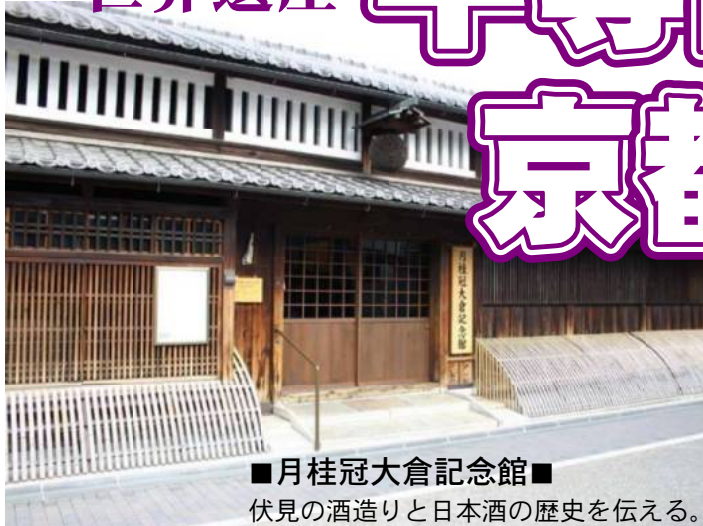
■月桂冠大倉記念館■ 伏見の酒造りと日本酒の歴史を伝える。