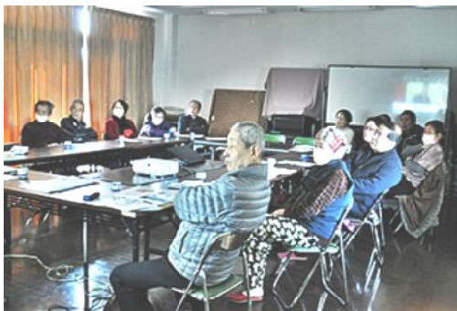
小池ビデオを真剣に観る参加者のみなさん