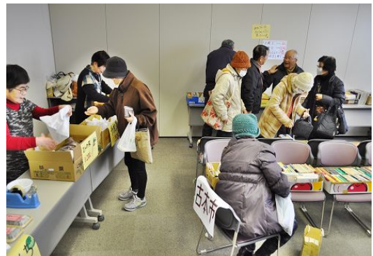
にぎわうバザー会場