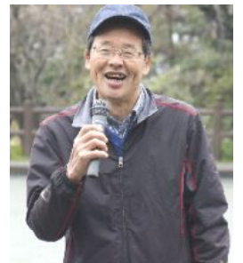
写真は去年の花見鍋のようすです