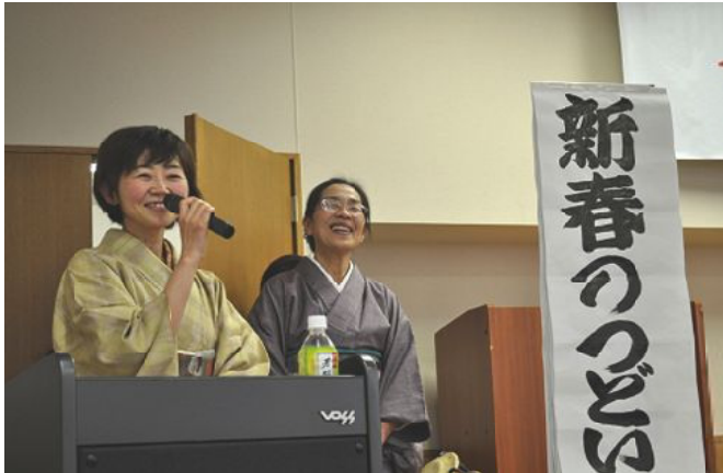
はじける笑顔 着物が似合う司会のお二人