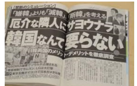
週刊ポスト9月13日号

まずは「日本に好感を持っている韓国人」「韓国に好感を持っている日本人」の声を聞いてください。みんな鈴鹿市内に住む人たち（今回たまたま女性ばかり）です。