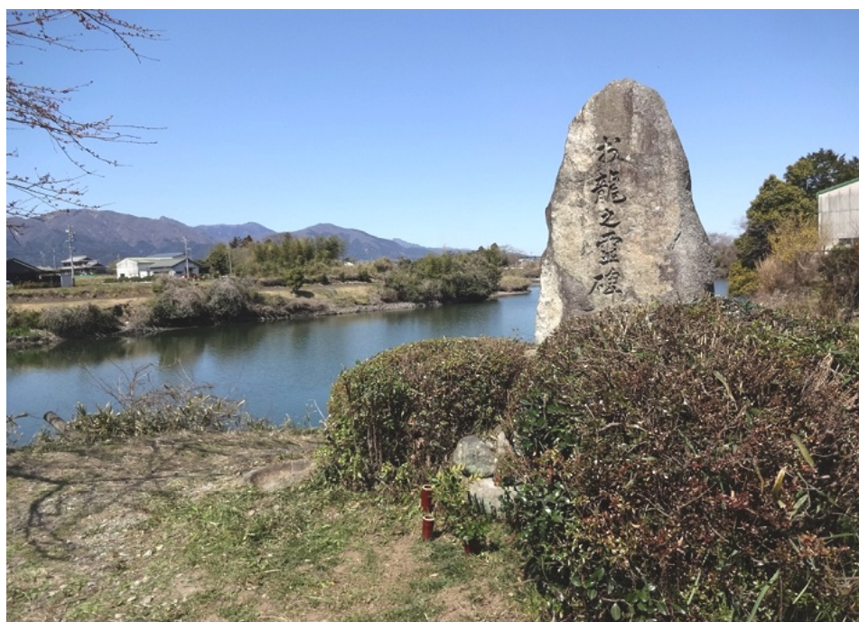
龍ヶ池とお龍之霊碑